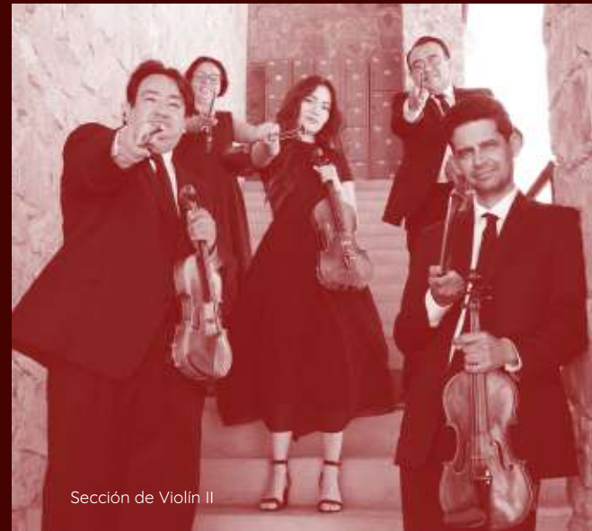
Sección de Violín II