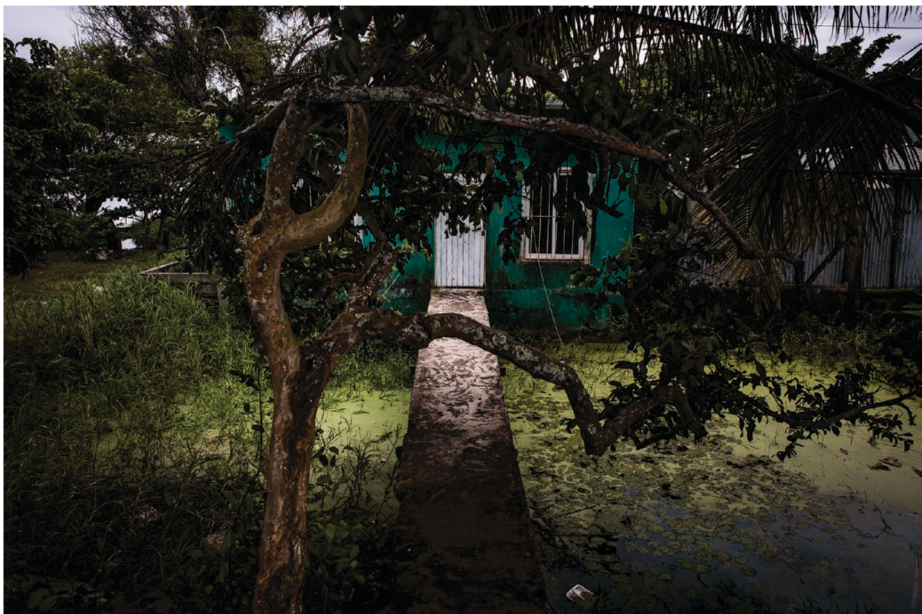
© Yael Martínez. De la serie Tierra mojada , 2016.

terminar una guerra, y por eso costó poner en la balanza sus beneficios y consecuencias. Llegada la paz, durante un tiempo se le vio como la solución al problema de la injusticia en el reparto de combustibles padecida por algunas naciones, y no faltó quien le endilgara el rol de saciar el apetito del mundo por la energía.