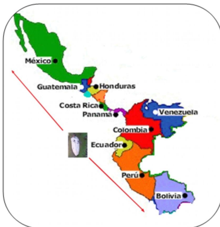
Figura 2. Ruta de avance de la moniliasis

Es producida por el hongo Moniliophthora roreri . Esta enfermedad se originó en Colombia por el año 1800 y paso a Ecuador en 1914 2 . Posteriormente se dispersó a diferentes países como: Perú, Bolivia, Venezuela, Panamá, Costa Rica, Honduras, Guatemala, Belice y México a partir del 2005 (Figura 2).