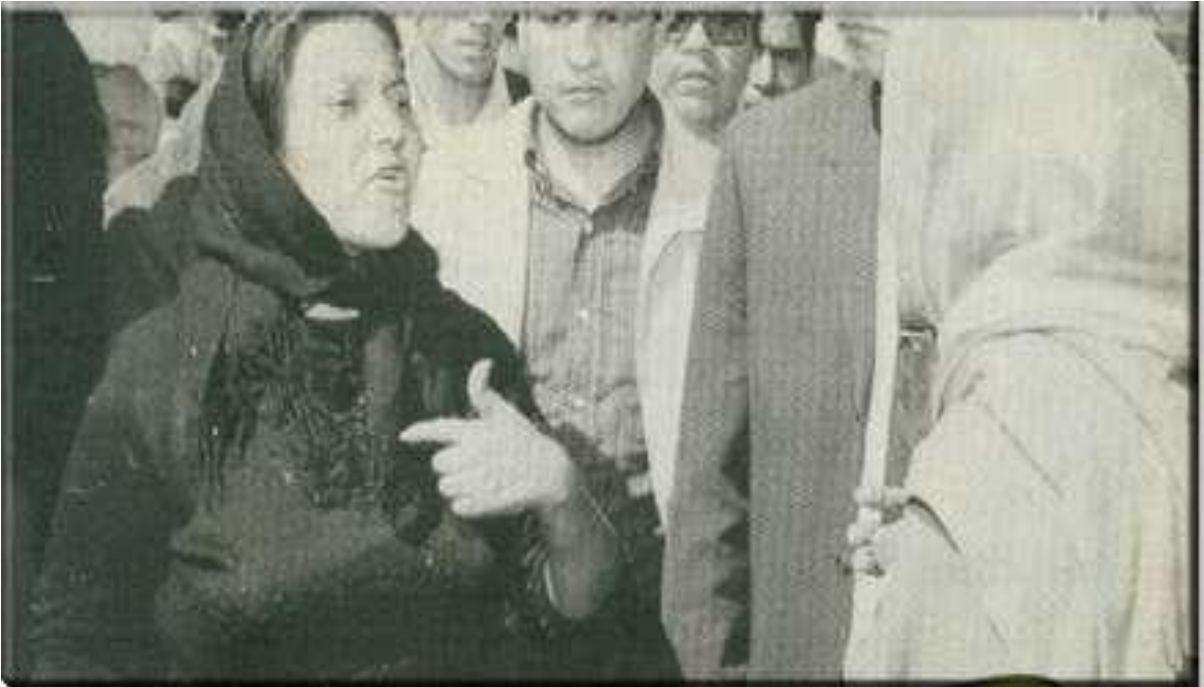
Fotografía de la revista "Alarma" (3)

La trata de blancas que en este caso especial se analiza, tubo el surgimiento en el pueblo de "San Felipe del Rincón" y Leon, en Guanajuato; las protagonistas de este hecho social fueron las hermanas Chuy, Delfa y Eva, apodadas las Poquianchis, pero también tenían otras dos hermanas de nombre Adelina y María Rosa, las cuales son entregadas por su padre llamado Rosario; el mencionado padre era un campesino que luchaba junto con otros mas, para que le fueran devueltas sus tierras de las que los habían despojado el gobierno y él tenia la esperanza de que sus hijas fueran colocadas para realizar trabajos de sirvientas en diferentes casas de familias adineradas para no tener tantos gastos, ya que era una forma de que sus hijas se pudieran mantener de ese modo; pero en realidad no fue así, fueron entregadas por un capitán de nombre "Mere" en uno de los burdeles de mala muerte del pueblo, lugar donde son encerradas y golpeadas por una