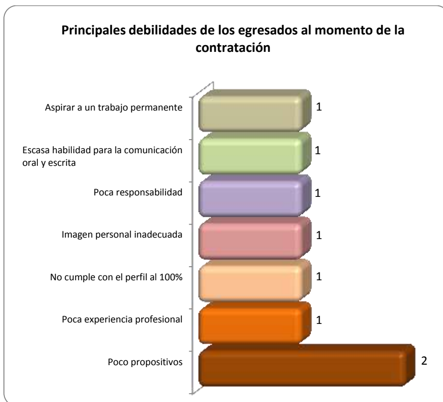
Gráfica 2.3 Principales debilidades de los egresados al momento de la contratación

En la Gráfica 2.3 se observa que las debilidades consideradas como las más importantes son: que son poco propositivos, esto en la opinión de los 2 empleadores; también la poca experiencia profesional, que no cumple con el perfil al 100%, la imagen personal es inadecuada, la poca responsabilidad, la escasa habilidad para la comunicación oral y escrita y aspirar a un trabajo permanente, considerado por un empleador respectivamente.