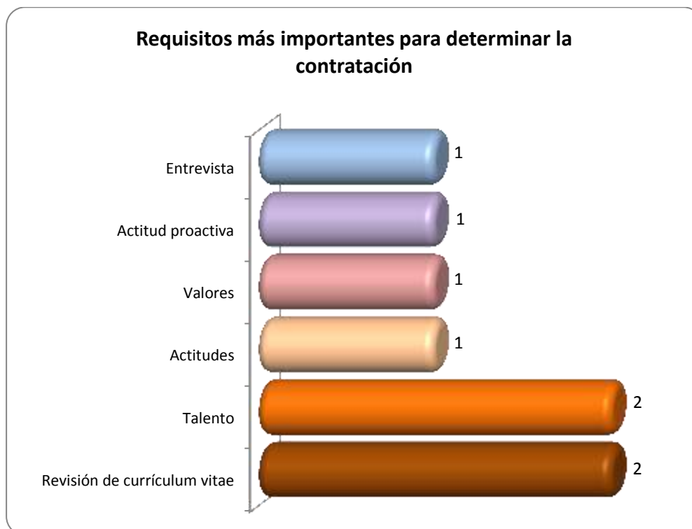
Gráfica 2.2 Requisitos más importantes para determinar la contratación

Otros requisitos importantes que requieren para determinar la contratación de los egresados se muestran en la Gráfica 2.2.